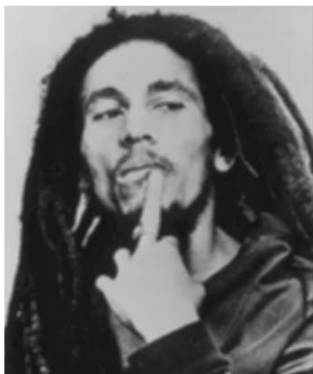
Burnin and lootin - Bob Marley