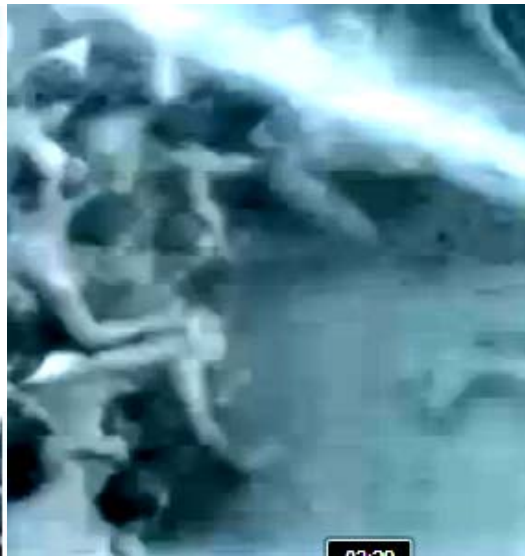
Les "étoiles" dominent la scène sur fond bleu...