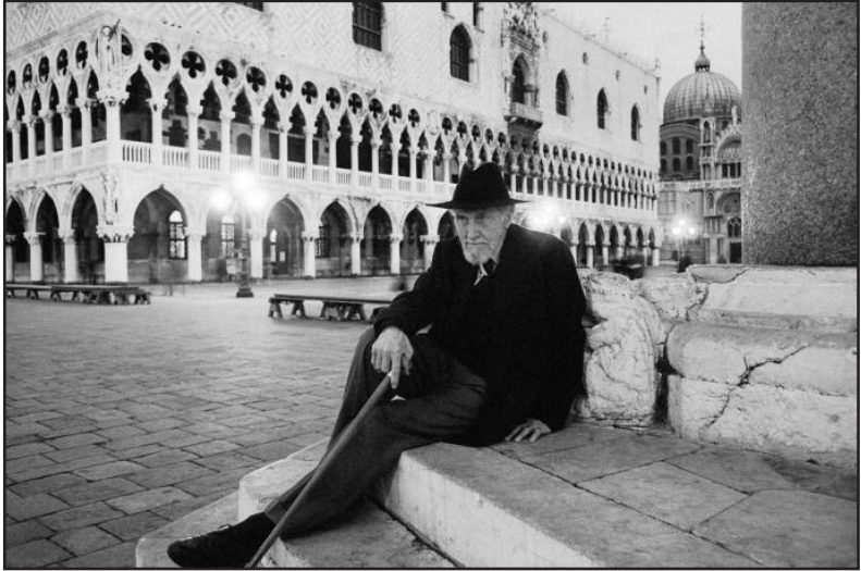
Ezra Pound à Venise, 1964