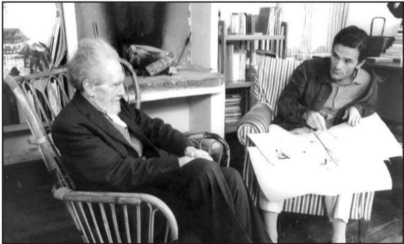
Ezra Pound et l'écrivain Pier Paolo Pasolini, entrevue pour la radio et la télévision italienne (RAI), octobre 1967.