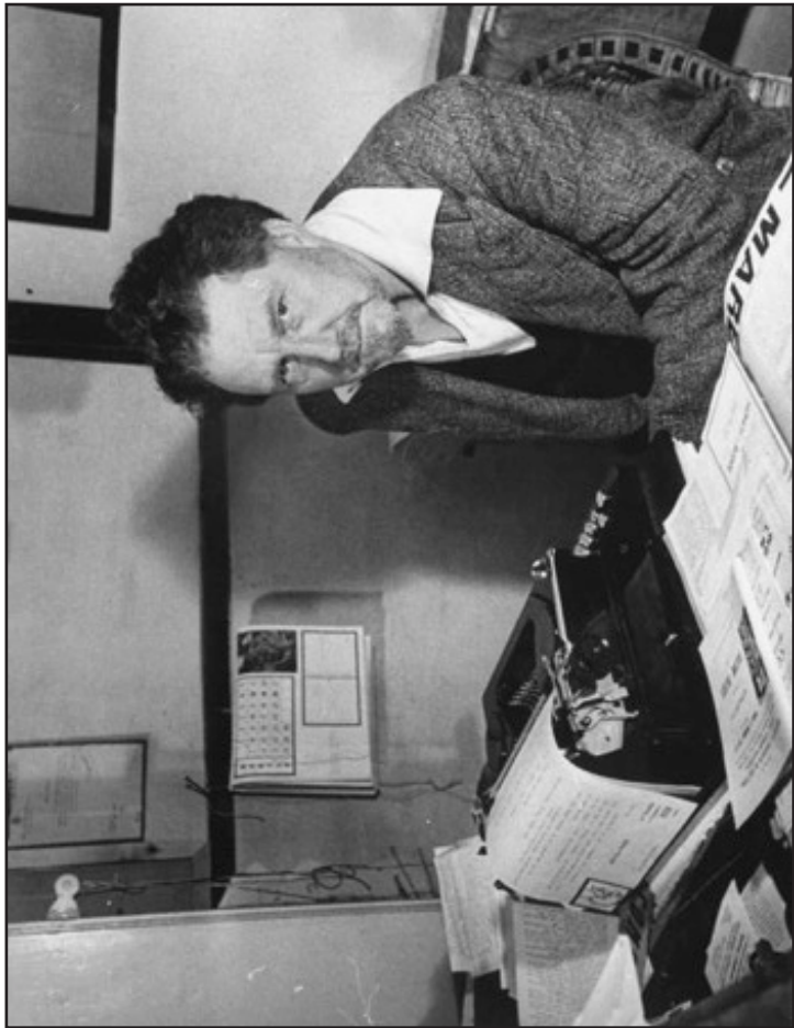
Ezra Pound, mai 1940, par Carl Mydans, The LIFE Picture Collection.