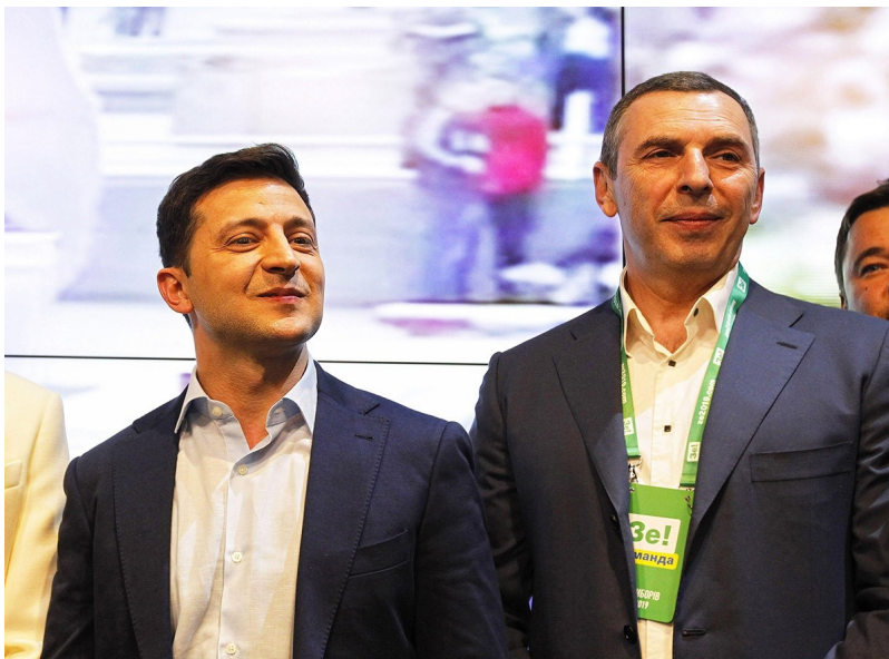
Zelensky et Serhiy Shefir

Les documents révèlent que Zelensky et ses partenaires juifs de Kvartal 95 ont mis en place un réseau de sociétés offshore remontant au moins à 2012, année où la société a commencé à produire régulièrement du contenu pour Ihor Kolomoisky. Ces sociétés offshore, qui ont permis de faire transiter l'argent de Kolomoisky par les îles Vierges britanniques, le Belize et Chypre afin d'échapper à l'impôt en Ukraine, ont également servi à des proches de Zelensky pour acquérir trois propriétés de prestige au cœur de Londres. Les documents montrent également que, juste avant son élection, Zelensky a cédé sa participation dans une société offshore clé, Maltex Multicapital Corp., immatriculée aux îles Vierges britanniques, à Serhiy Shefir, qui allait devenir son principal conseiller présidentiel. Malgré cette cession, les documents indiquent qu'un arrangement a rapidement été conclu pour permettre à la société offshore de continuer à verser des dividendes à une entreprise appartenant désormais à l'épouse de Zelensky.